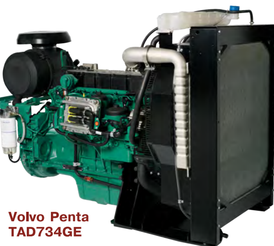
Volvo Penta TAD734GE

В дизельных генераторах установлен двигатель Volvo Penta TAD734GE мощностью 363 л.с. Двигатель шестицилиндровый, рабочий объем 7,15 л, с рядным расположением цилиндров и системой впрыска с электронным управлением форсунками Common rail.